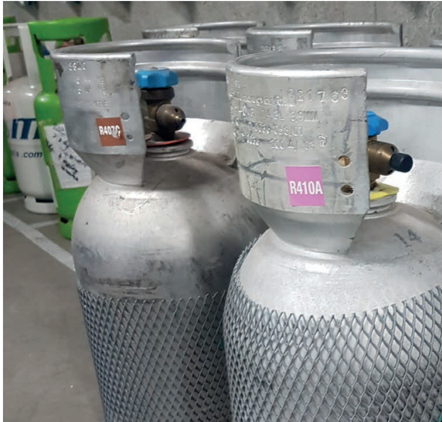
△ Om de voorraad koudemiddelen in de markt te managen, zijn de prijzen voor een afgevulde fles flink gestegen: dat merkt...

Het meest gebruikte koudemiddel in airco's en warmtepompen is sterk in prijs gestegen. Het is het gevolg van Europese wetgeving om het gebruik van klimaatschadelijke koudemiddelen tot 2030 fors te verminderen. Op korte termijn zou R410a al kunnen opraken. Een alternatief is R454b, maar mag dat in bestaande systemen?