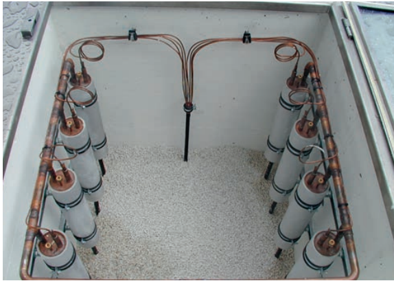
△ Koudemiddel CO 2 in een verticale bron.

Het meest gebruikte koudemiddel in airco's en warmtepompen is sterk in prijs gestegen. Het is het gevolg van Europese wetgeving om het gebruik van klimaatschadelijke koudemiddelen tot 2030 fors te verminderen. Op korte termijn zou R410a al kunnen opraken. Een alternatief is R454b, maar mag dat in bestaande systemen?